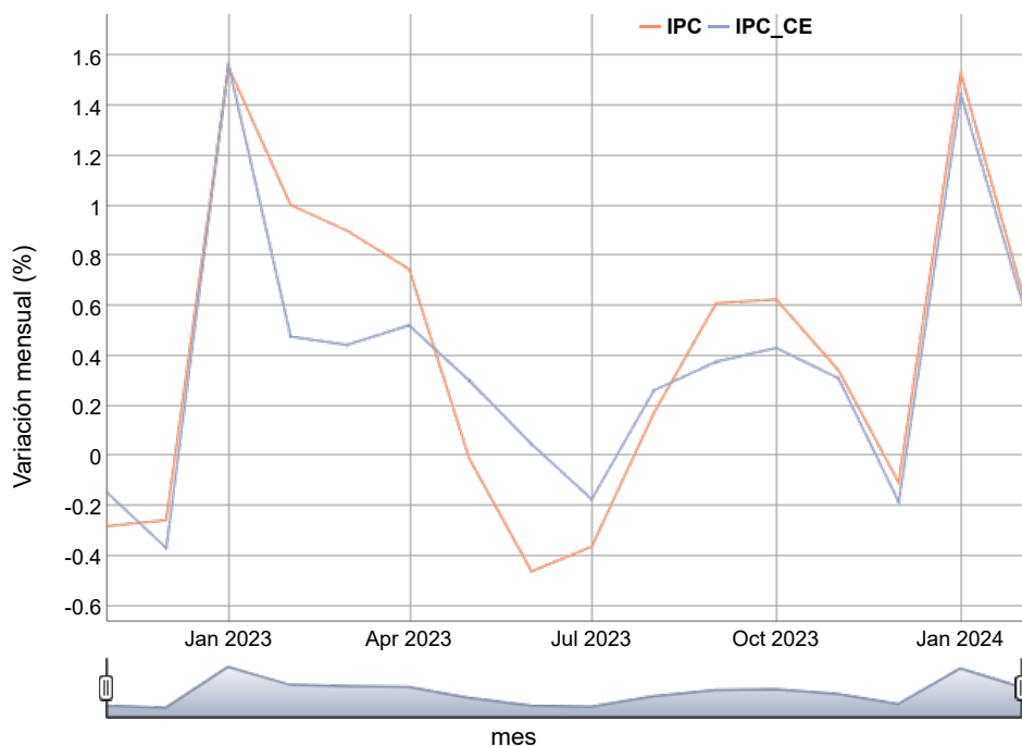
Cuadro 2: Índices y variaciones mensuales del IPC-CE.